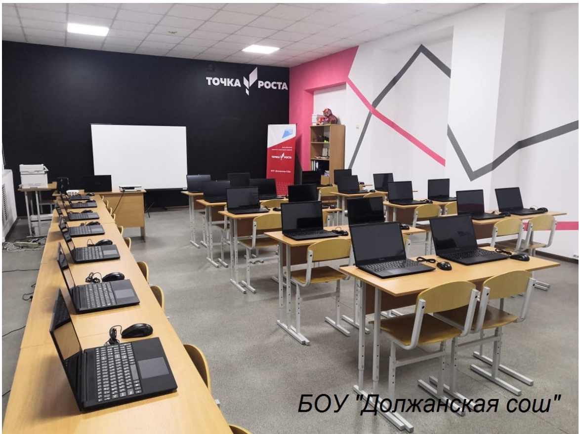
БОУ "Должанская сош"