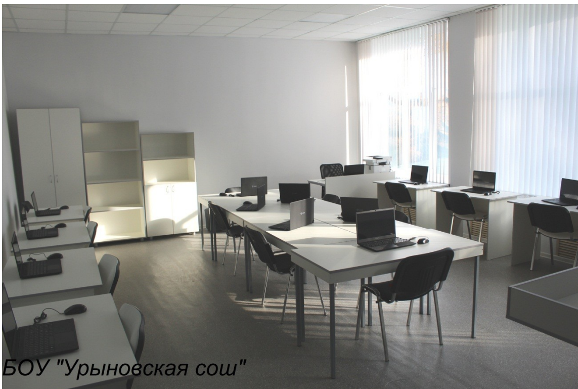
БОУ "Урыновская сош"